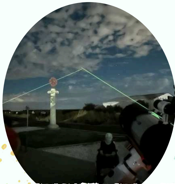
OBSERVACIÓN ASTRONÓMICA 2024