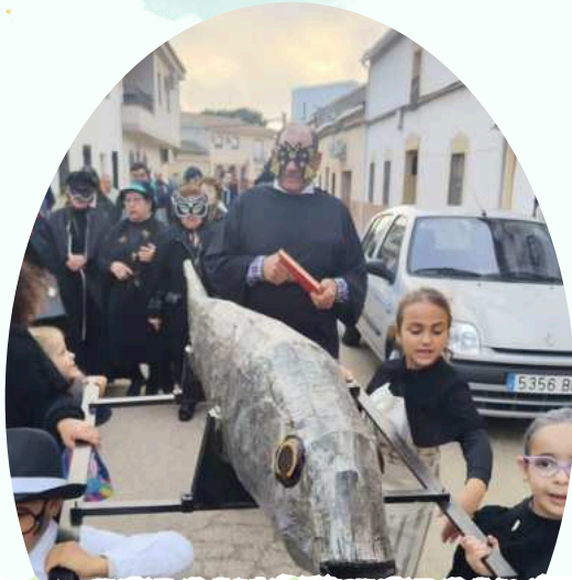
ENTIERRO DE LA SARDINA 2024