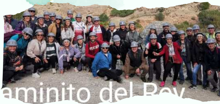
LA JUNTA DIRECTIVA

OS DESEAMOS A TOD@S LOS VECIN@S Y VISITATES QUE DISFRUTÉIS DE ELLAS, CON ALEGRÍA Y MUCHA DIVERSIÓN.